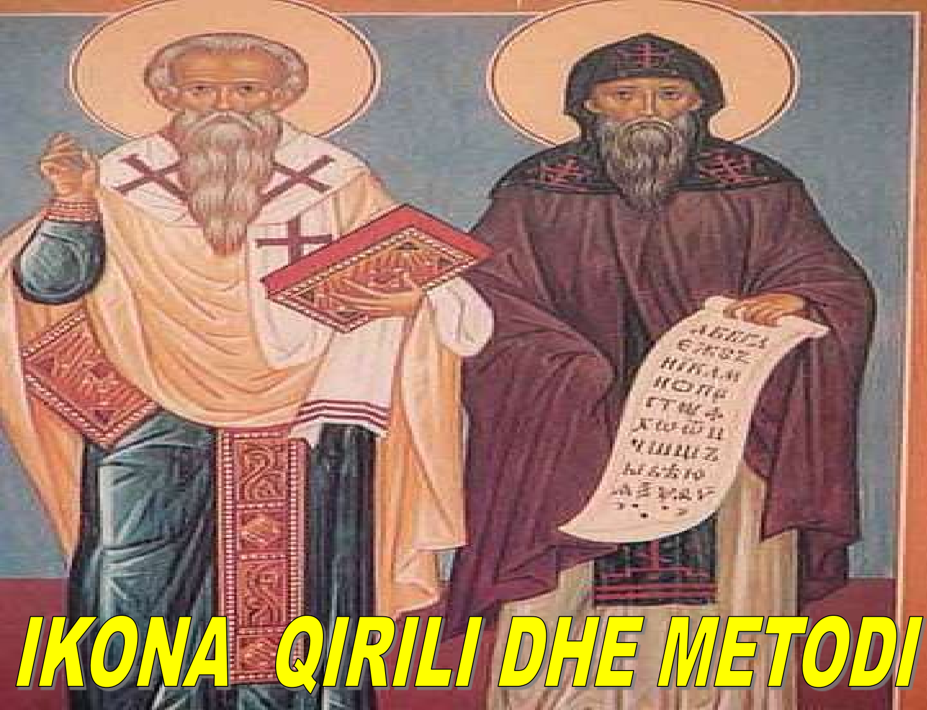
IKONA QIRILI DHE METODI